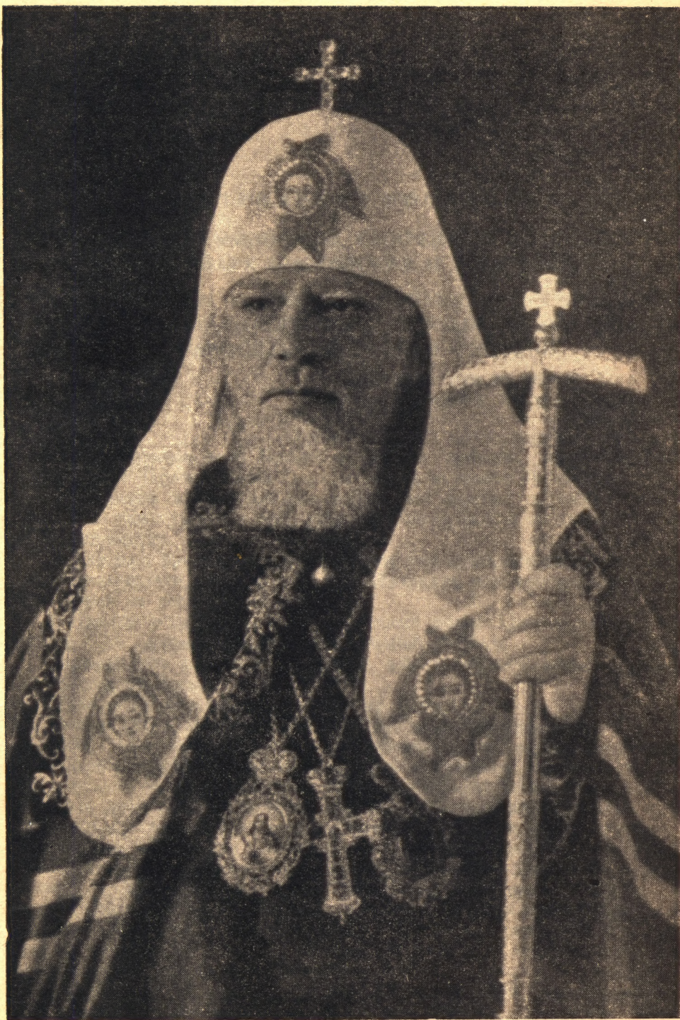
Святейший Алексий Патриарх Московский и всея Руси